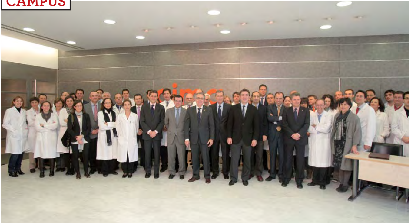
Algunos de los investigadores, técnicos y autoridades que asistieron a la presentación del futuro centro.