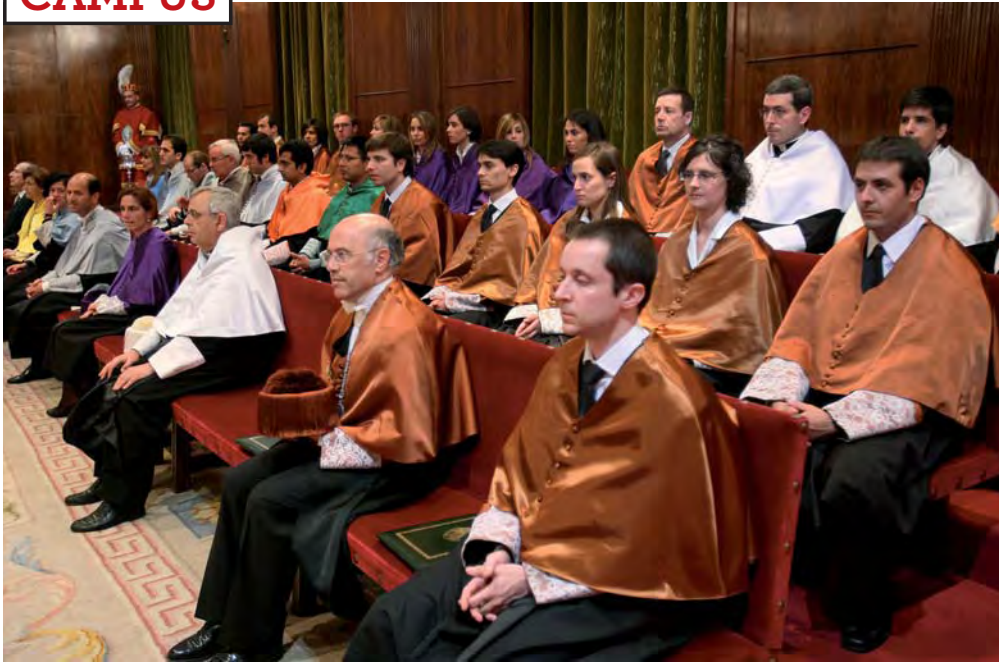
Los nuevos doctores durante el acto de investidura celebrado en el Aula Magna de la Universidad de Navarra. En el último año se han defendido en el centro 160 tesis.