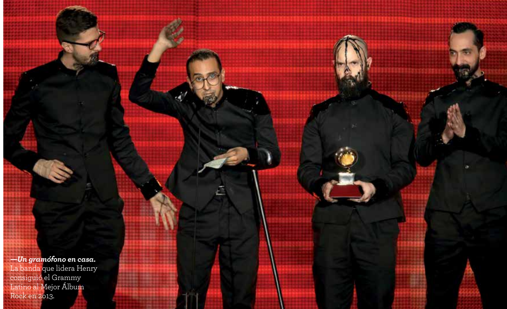
—Un gramófono en casa.

He empezado a escuchar reggae últimamente. Leyendo sobre la vida de Bob Marley te das cuenta de que hubo gente que provocó un verdadero cambio en su sociedad. He estado investigando nuevas formas para abordar la producción del próximo disco, y lo que puedo asegurarte es que en mi cabeza juegan en una misma liga Bob Marley , Dr. Seuss y el conflicto venezolano a través de los medios. Soy totalmente consciente del caos mental que tengo ahora mismo, pero hay una cosa que veo con claridad: me gustaría contar una historia no a través de las personas, sino de la tecnología que utilizan esas personas para expresarse.