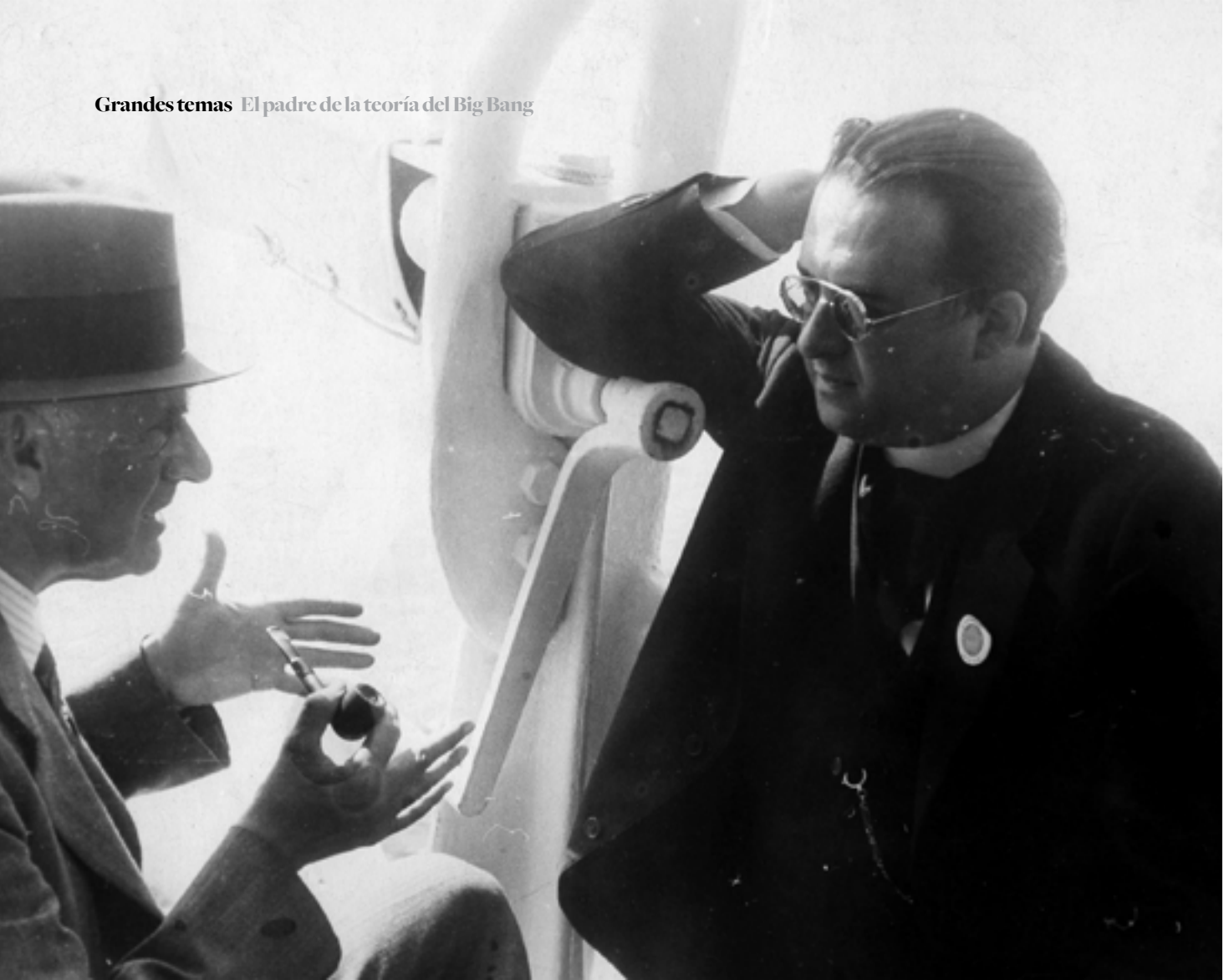
Lemaître conversa con su profesor y mentor, el astrofísico británico Arthur Eddington.

Estas ideas de su antiguo profesor llevaron a Lemaître a replantearse la cuestión del origen del Cosmos, y a preguntarse si era compatible con la Física que el Universo hubiese tenido un comienzo. Al no encontrar contradicción, se lanzó a reformular su modelo cosmológico, completándolo con lo que sabía de Física cuántica en lo que llamó “la hipótesis del átomo primitivo”, ahora conocido como Big Bang. Esencialmente, añadió una fase inicial a las dos propuestas anteriores para así dar al Universo una edad finita. Todo comenzaba en un punto, donde las leyes físicas perdían todo su sentido, en el que el Universo entraba en expansión y el espacio se “llenaba” con los productos de la desintegración de un átomo primitivo, desintegraciones semejantes a las radiactivas, que darían lugar a la materia, al espacio y al tiempo, tal como hoy los co-