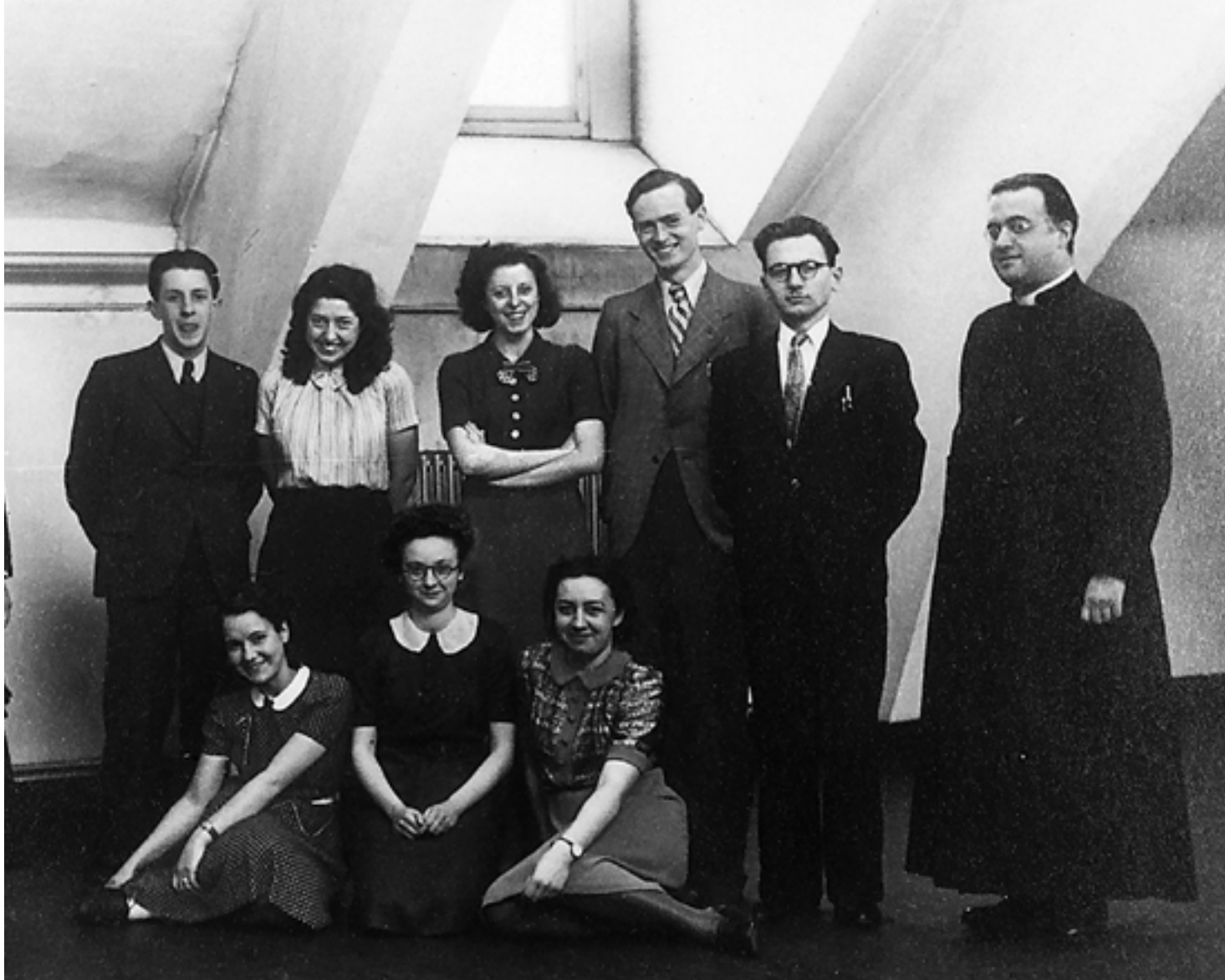
Lemaître con un grupo de alumnos de la Universidad Católica de Lovaina.

reunión habitual de la Real Sociedad Astronómica. En ella, De Sitter mostró sus dudas sobre el modelo estático de Einstein , opinión compartida por Eddington . Cuando Lemaître leyó las actas de la reunión volvió a escribir a su antiguo profesor de Cambridge para recordarle que hacía tiempo que había propuesto una solución a ese problema. Eddington cayó en la cuenta del “olvido” y rectificó dando una conferencia titulada “La inestabilidad del Universo esférico de Einstein”, en la que explicó la solución que Lemaître había propuesto.