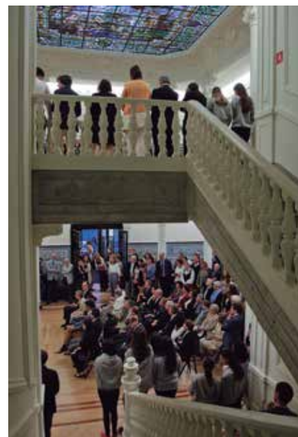
Tras un arresku de bienvenida, el evento prosiguió en el vestíbulo.