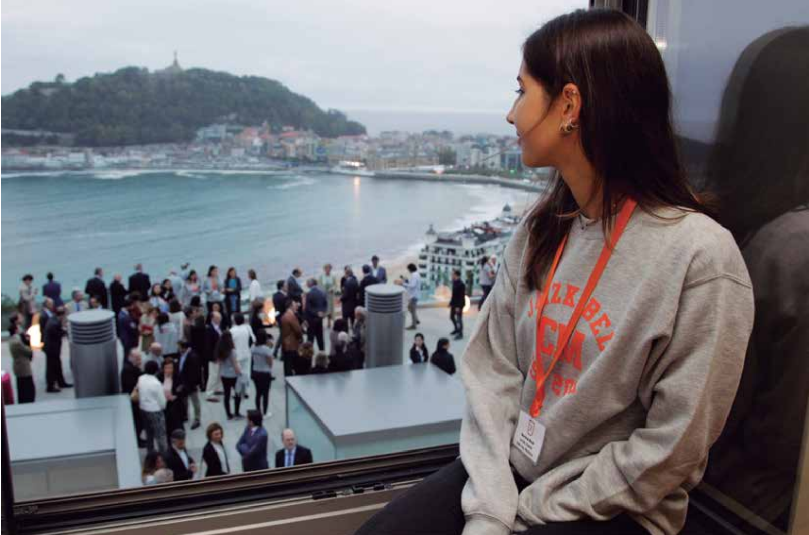
Un grupo de alumnos del Conservatorio Superior de Música del País Vasco-Musikene amenizó el acto de inauguración.