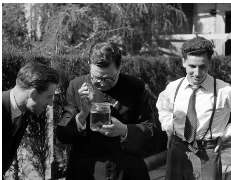
1952. Villa Tevere (Roma).