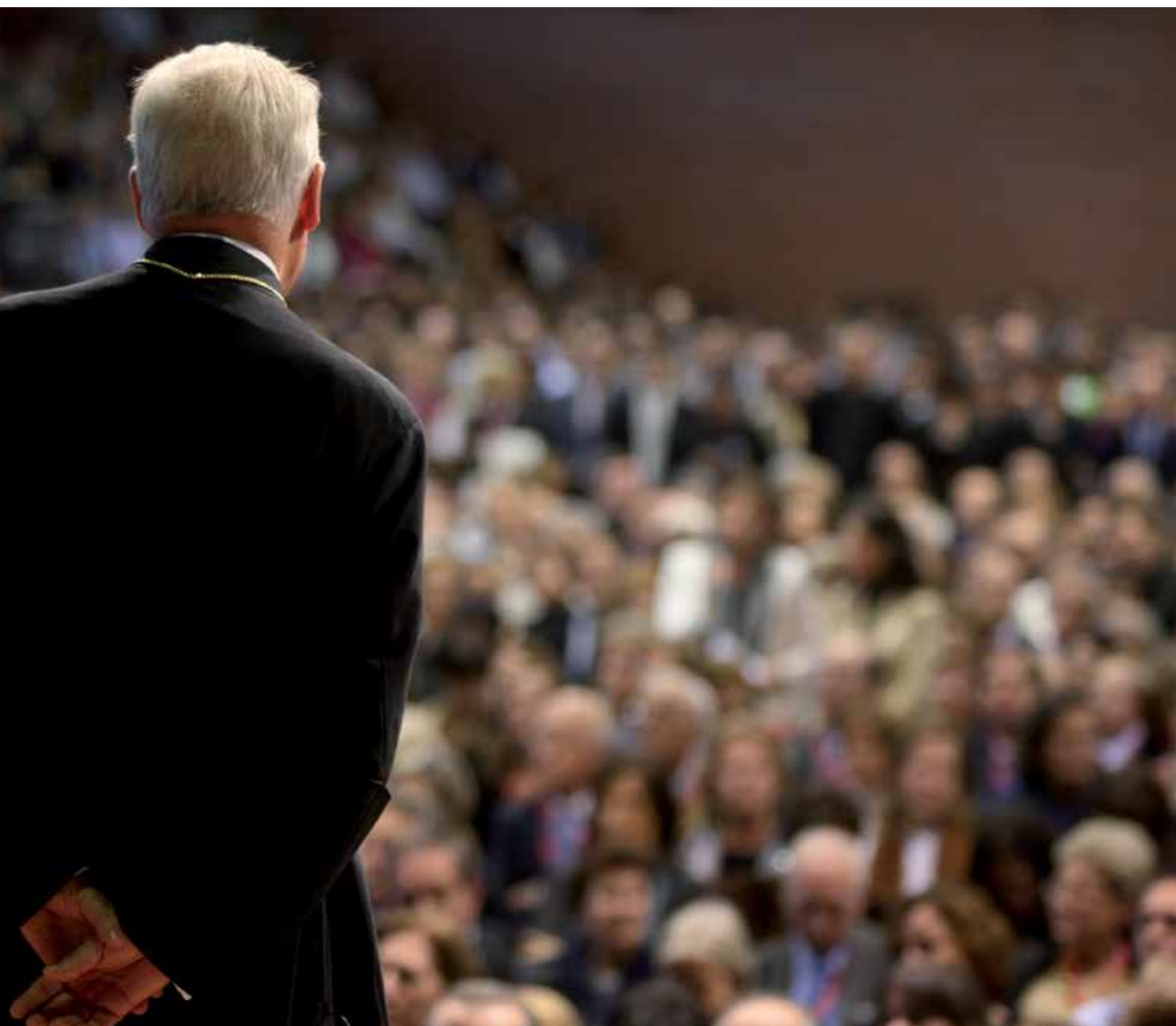
con miembros de la Asociación de Amigos, en su cincuenta aniversario.

❁ La libertad personal no debe entrar en conflicto con la unidad de propósitos y la coordinación de ideas que caracterizan una Universidad.