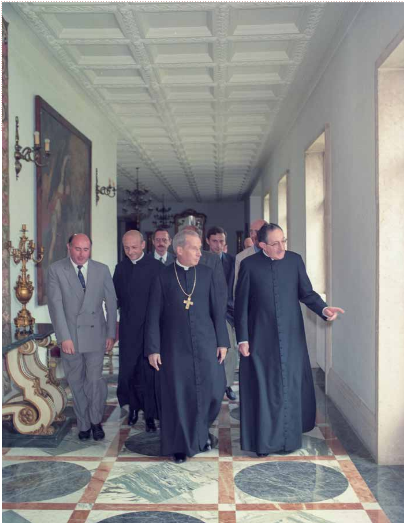
1994. Rectorado. Primera visita como Gran Canciller de la Universidad de Navarra.