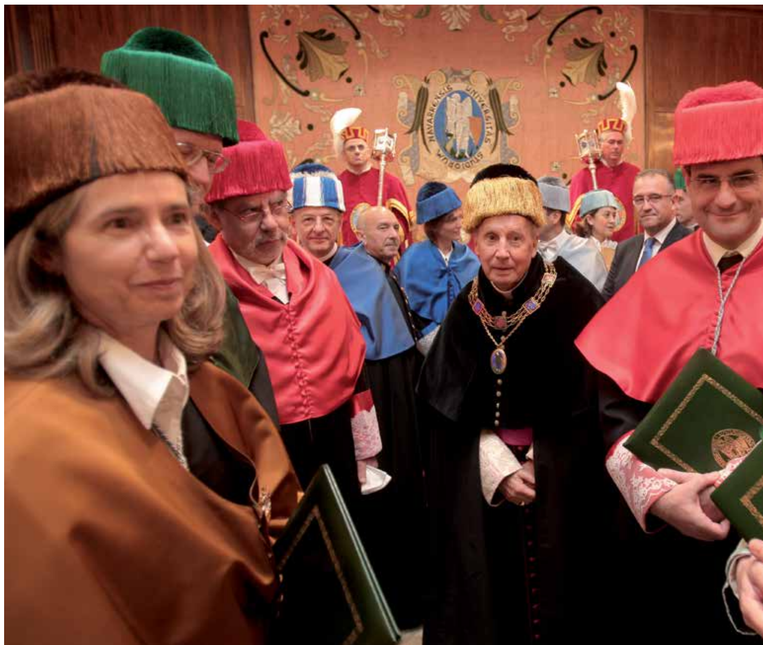
2011. Aula Magna de la Universidad. Ceremonia de investidura de doctores honoris causa .

❁ No basta enseñar a producir, a rendir, a ganar. Lo que importa de verdad es aprender a vivir rectamente.