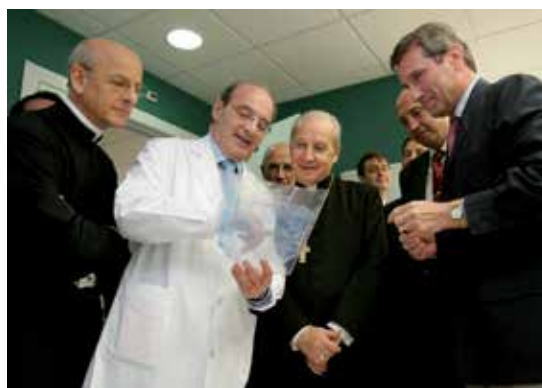
2005. Centro de Investigación Médica Aplicada.