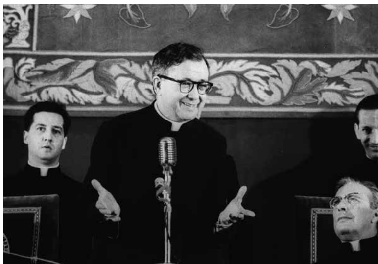
1964. Teatro Gayarre. Primera Asamblea de la Asociación de Amigos.