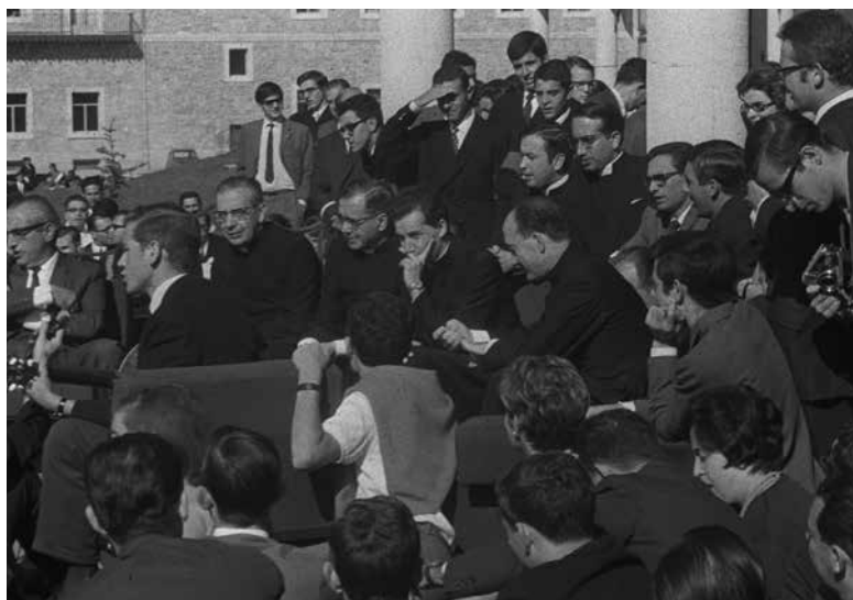
1967. Campus. Segunda Asamblea de la Asociación de Amigos.

❁ Si tuviera que dar un consejo, sugeriría fomentar el diálogo interdisciplinar, ser dóciles a la verdad y humildes de inteligencia para rectificar o recomenzar cuantas veces sea necesario.