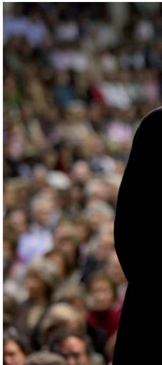
2010. Polideportivo de la Universidad. Encuentro