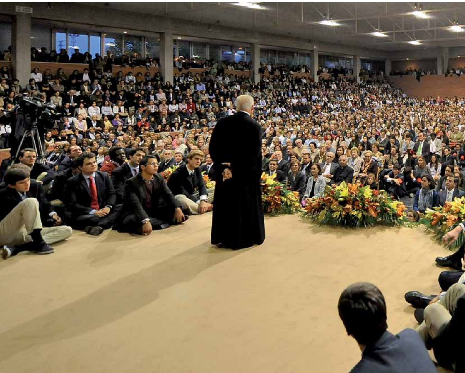
2011. Polideportivo. Tertulia con integrantes de la comunidad universitaria.

❁ La Universidad mantiene sus puertas abiertas a los graduados: son siempre bienvenidos, y se agradecen sus ideas y sugerencias.