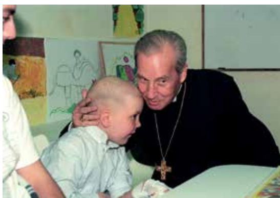
1998. Clínica Universidad de Navarra.