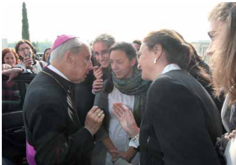
2010. Campus. Antes de la visita a una exposición en la Biblioteca.