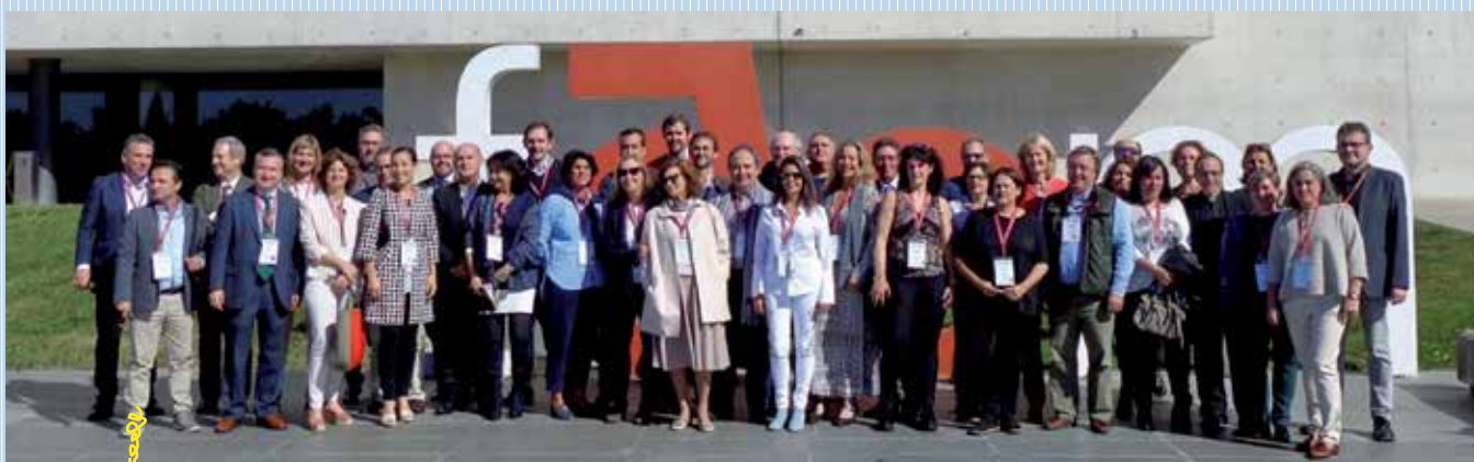
Com 92. La promoción de la Facultad de Comunicación del 92 conmemoró sus bodas de plata. Antiguos alumnos de Medicina, Enfermería, Nutrición y Dietética, Económicas, Derecho y Farmacia también celebraron sus veinticinco años.