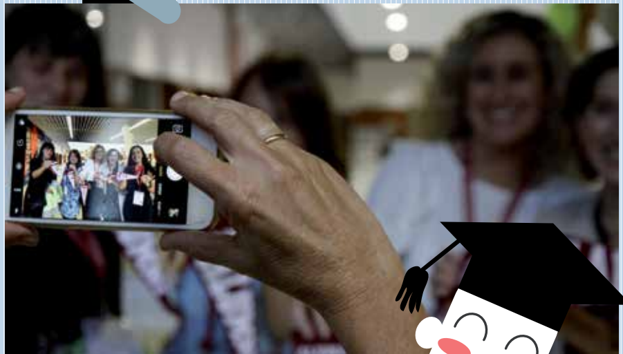
Inmortalizar reencuentros . Antiguos alumnos de veintidós promociones se dieron cita en el campus.