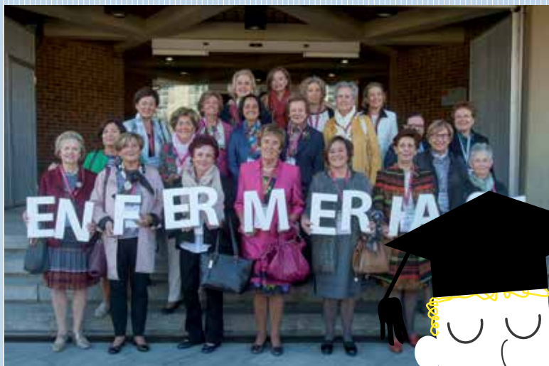
Enf 67. Promociones de Enfermería, Derecho, Historia, Medicina y Periodismo cumplían cincuenta años.