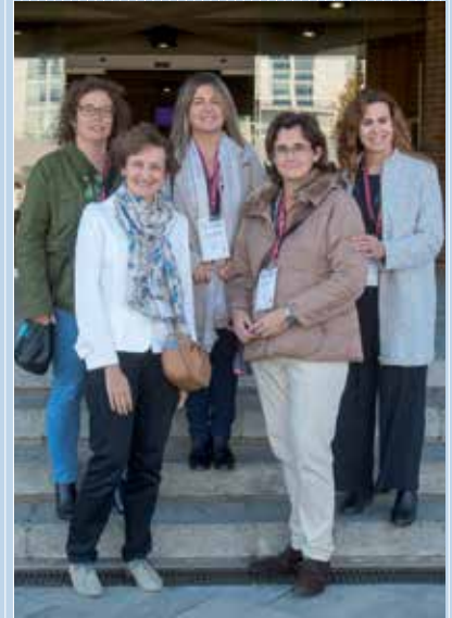
Desde 1992 . Graduadas de Nutrición y Dietética, veinticinco años después.