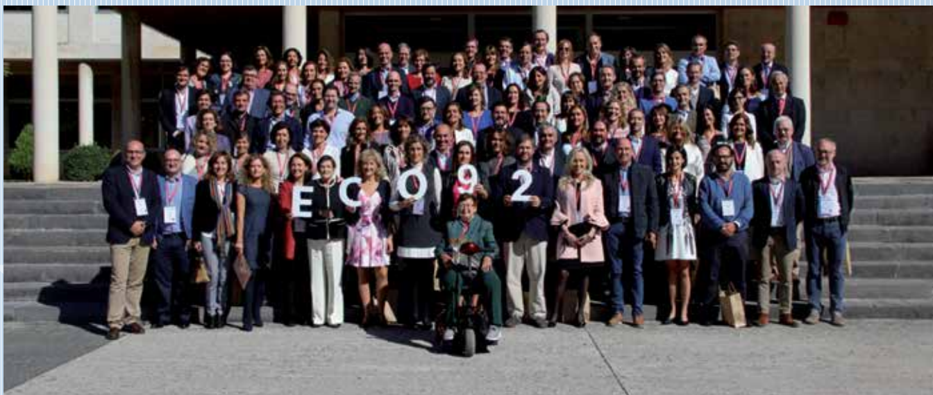
Eco 92. La primera promoción de la Facultad de Económicas celebró su veinticinco aniversario. Con ochenta y ocho inscritos, fue la que más graduados reunió.